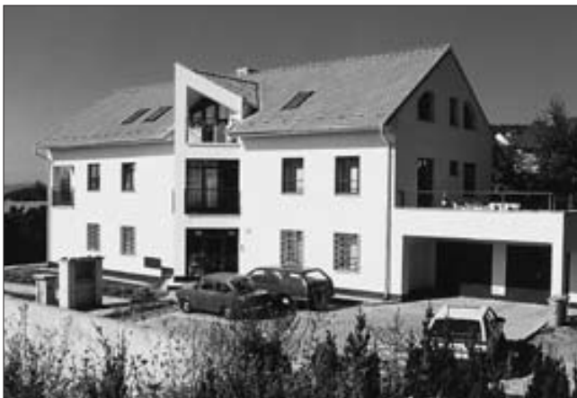
Kdosi komentoval rychlost stavby slovy: „Instantní budova“ (květen '97).

Na každého půl roku vypracováváme termínový kalendář pro odesílání pořadů.